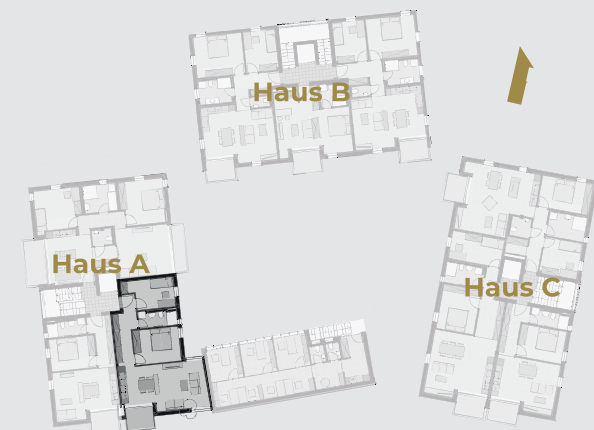
Erstes Obergeschoss - Etagenansicht